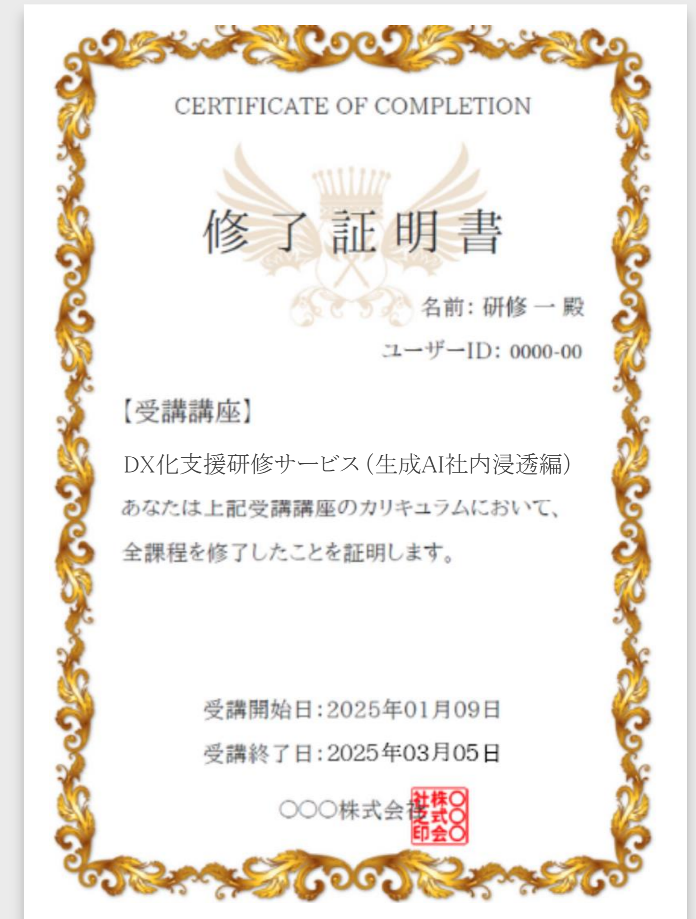
修了証明書イメージ

※直感的に操作が可能なプラットフォーム設計・受講を完了した証として、修了証明書が発行されます。