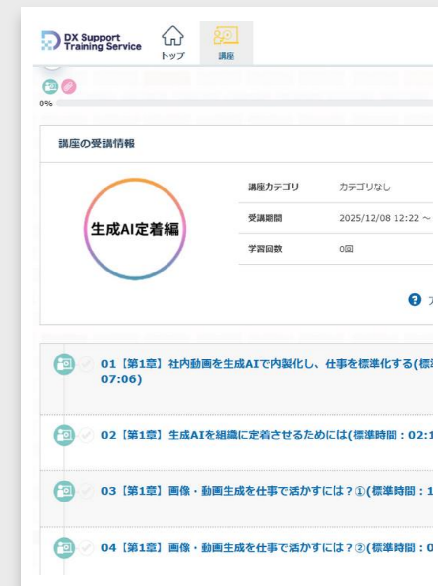
プラットフォームイメージ