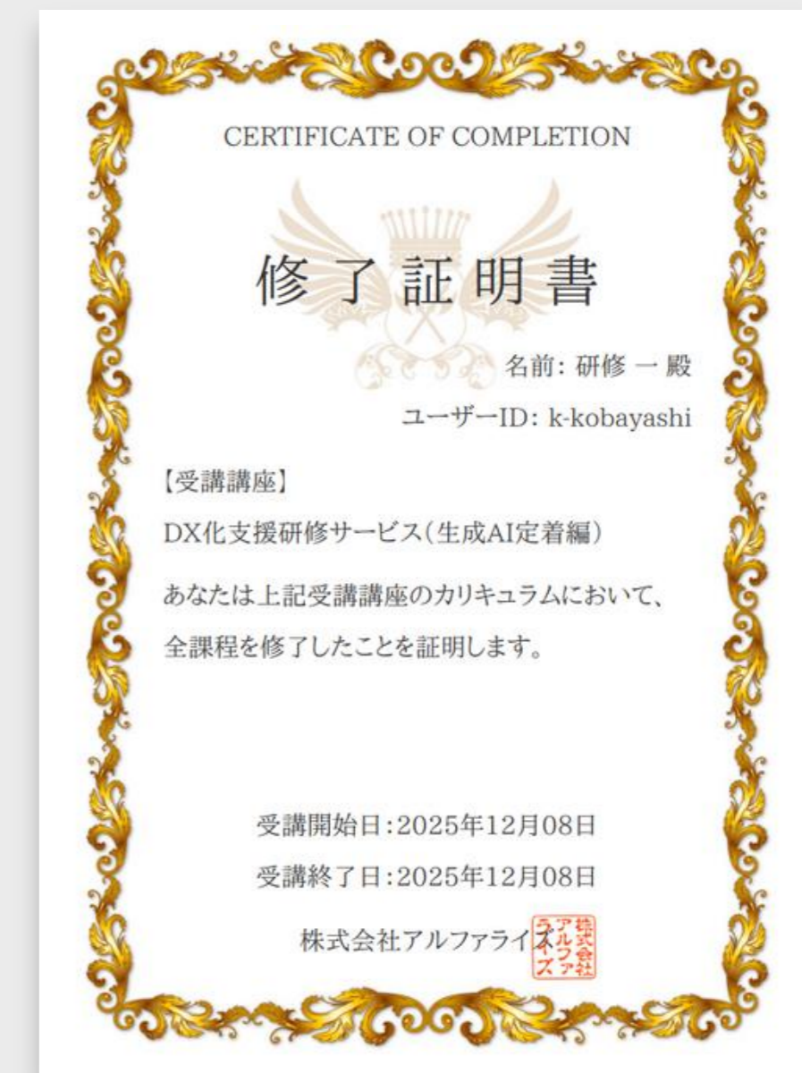
修了証明書イメージ

※直感的に操作が可能なプラットフォーム設計・受講を完了した証として、修了証明書が発行されます。